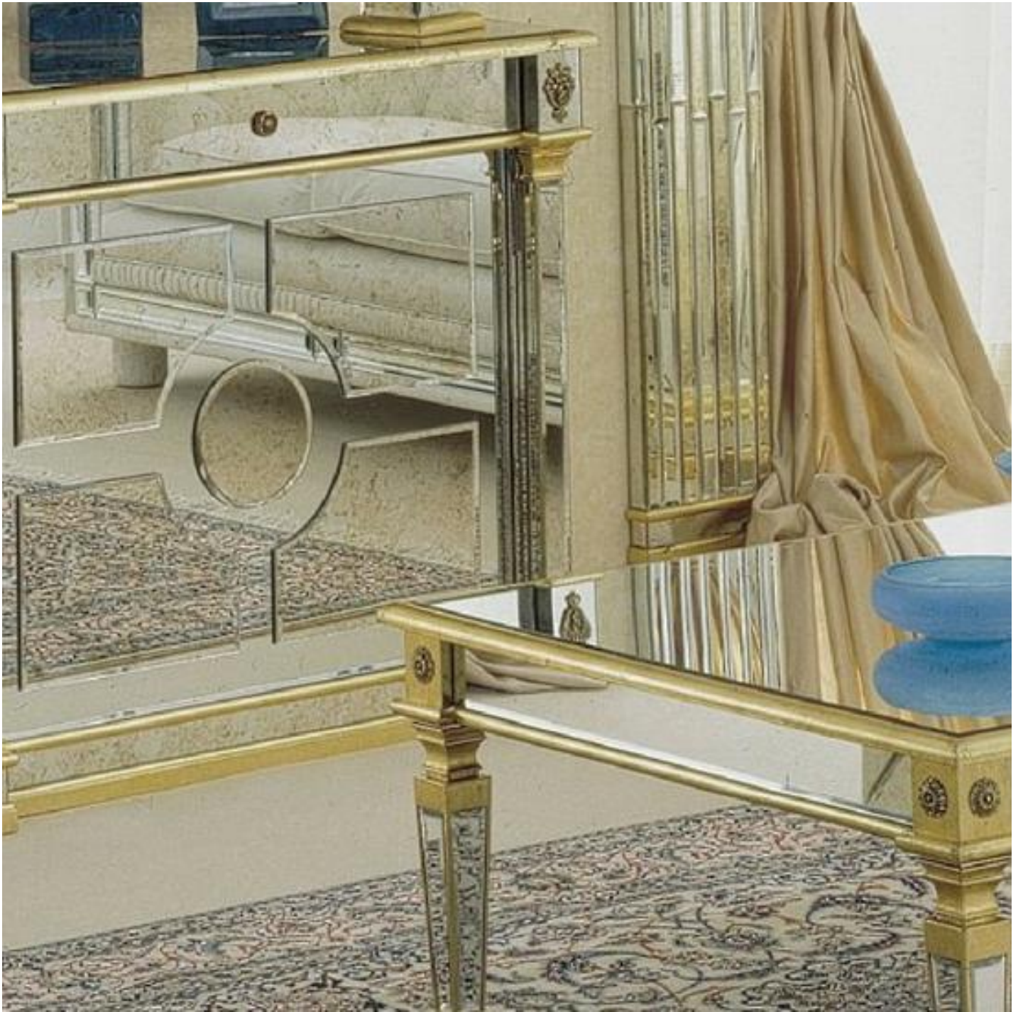
Miroirs décoratifs d'intérieur