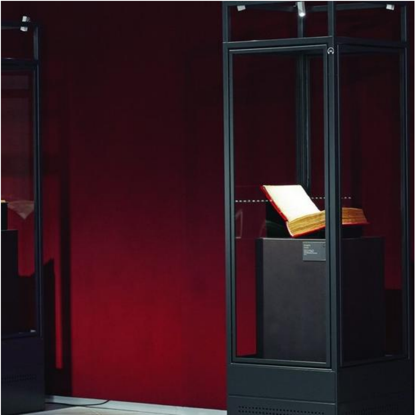
Guide de choix – Impression digitale