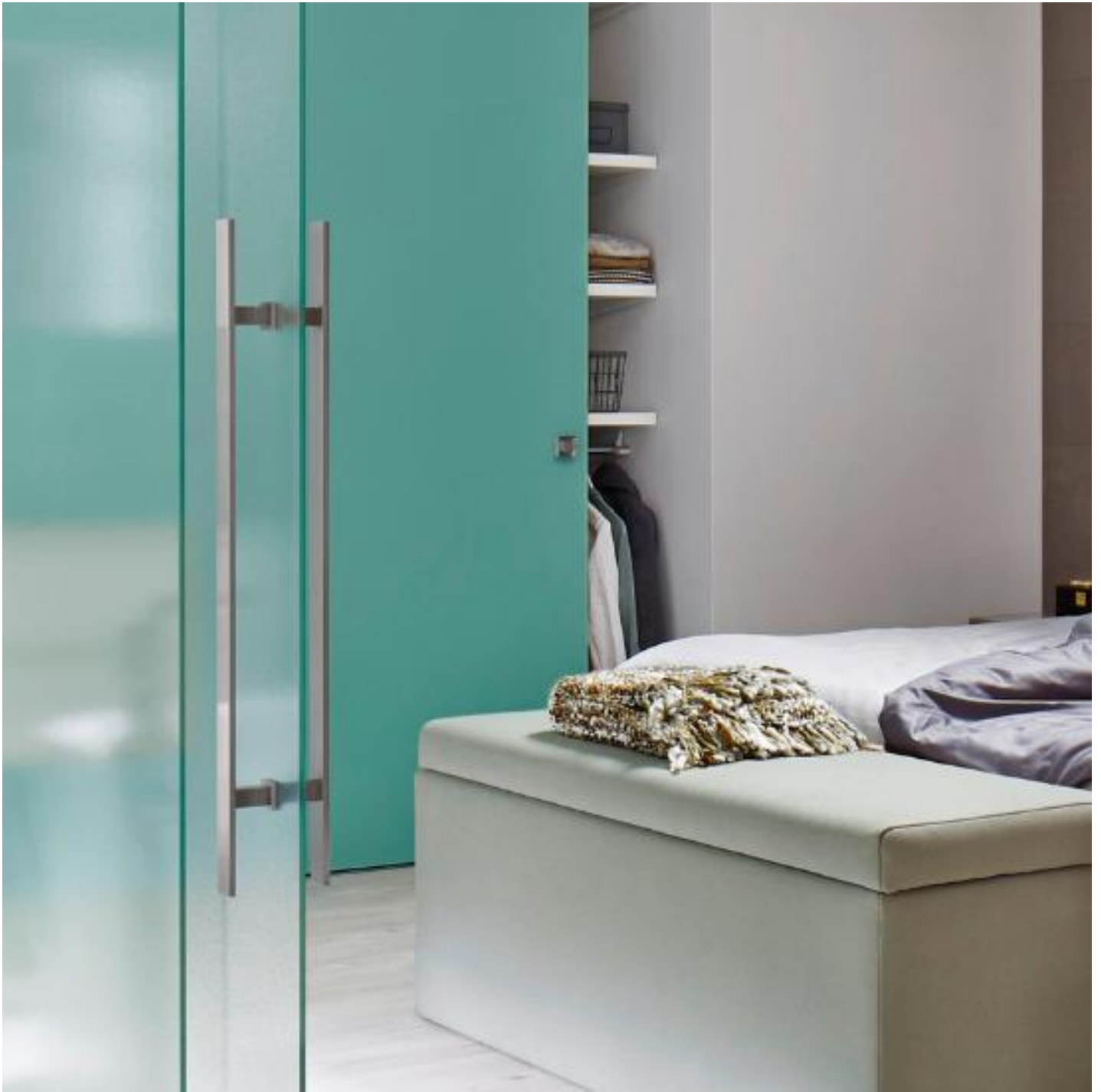
GUIDE DE CHOIX - PORTES EN VERRE POUR L'INTÉRIEUR