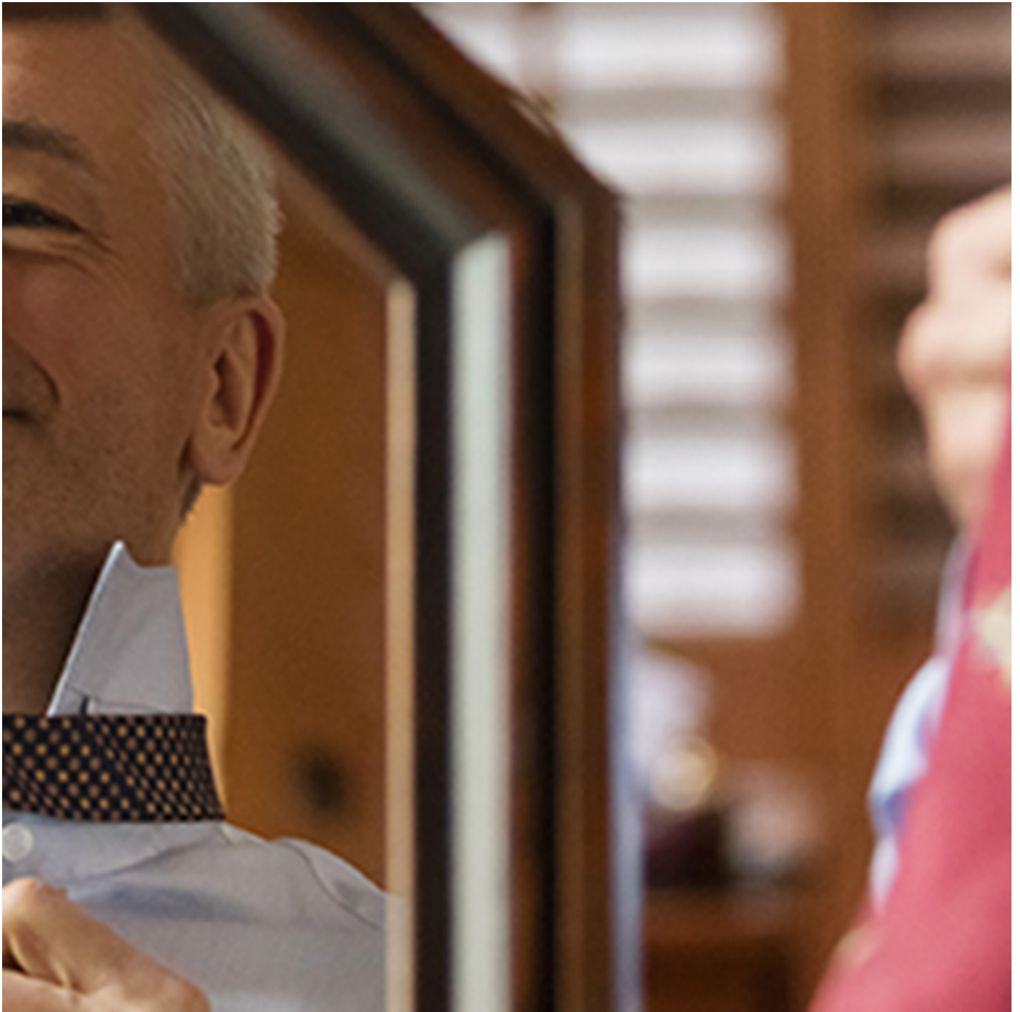
Miroir "Bonne Mine" - MIRALITE NATURA