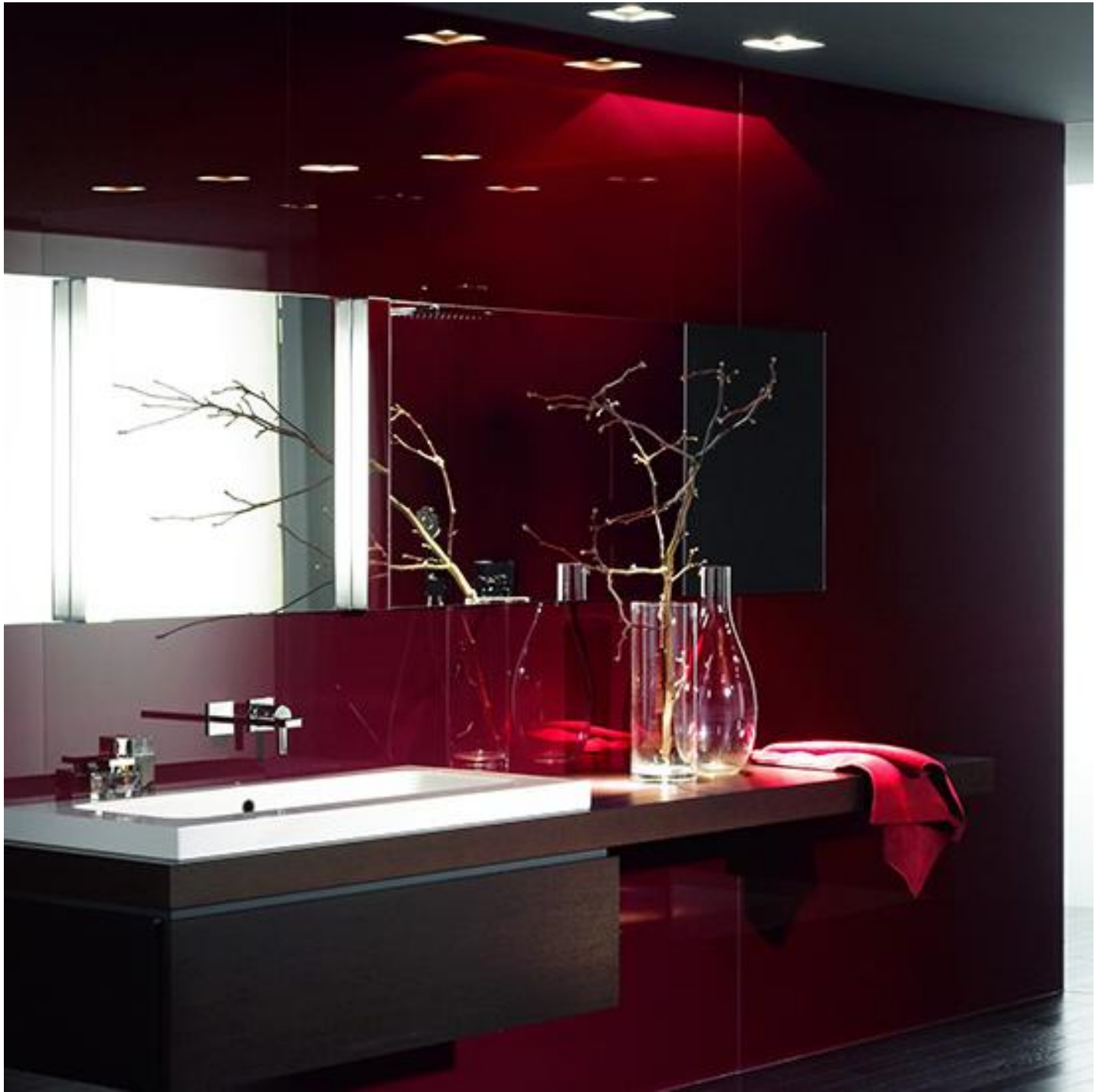
Verre laqué et coloré