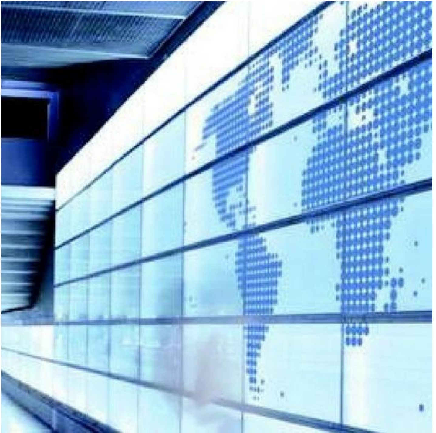
Impression digitale sur verre - Applications extérieures et intérieures