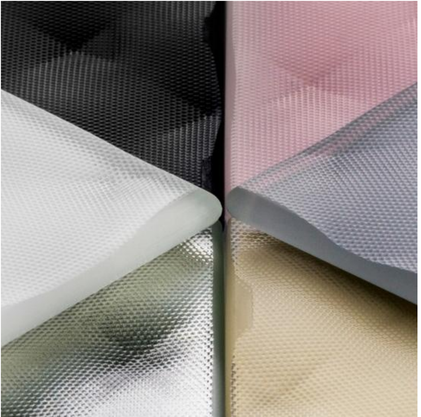
Verres colorés : texturés et laqués