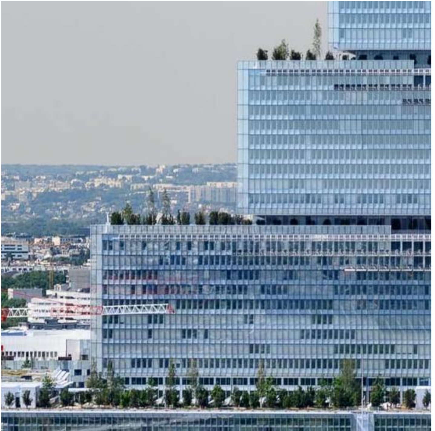
CONTRÔLE SOLAIRE NON SÉLECTIF : COOL-LITE ST BRIGHT SILVER