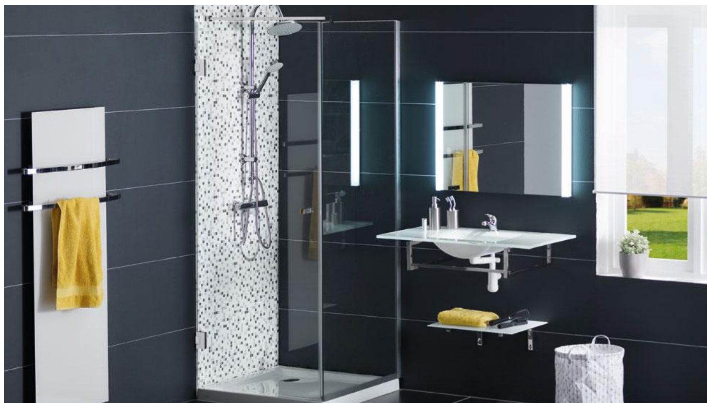
TIMELESS GLASS SHOWER