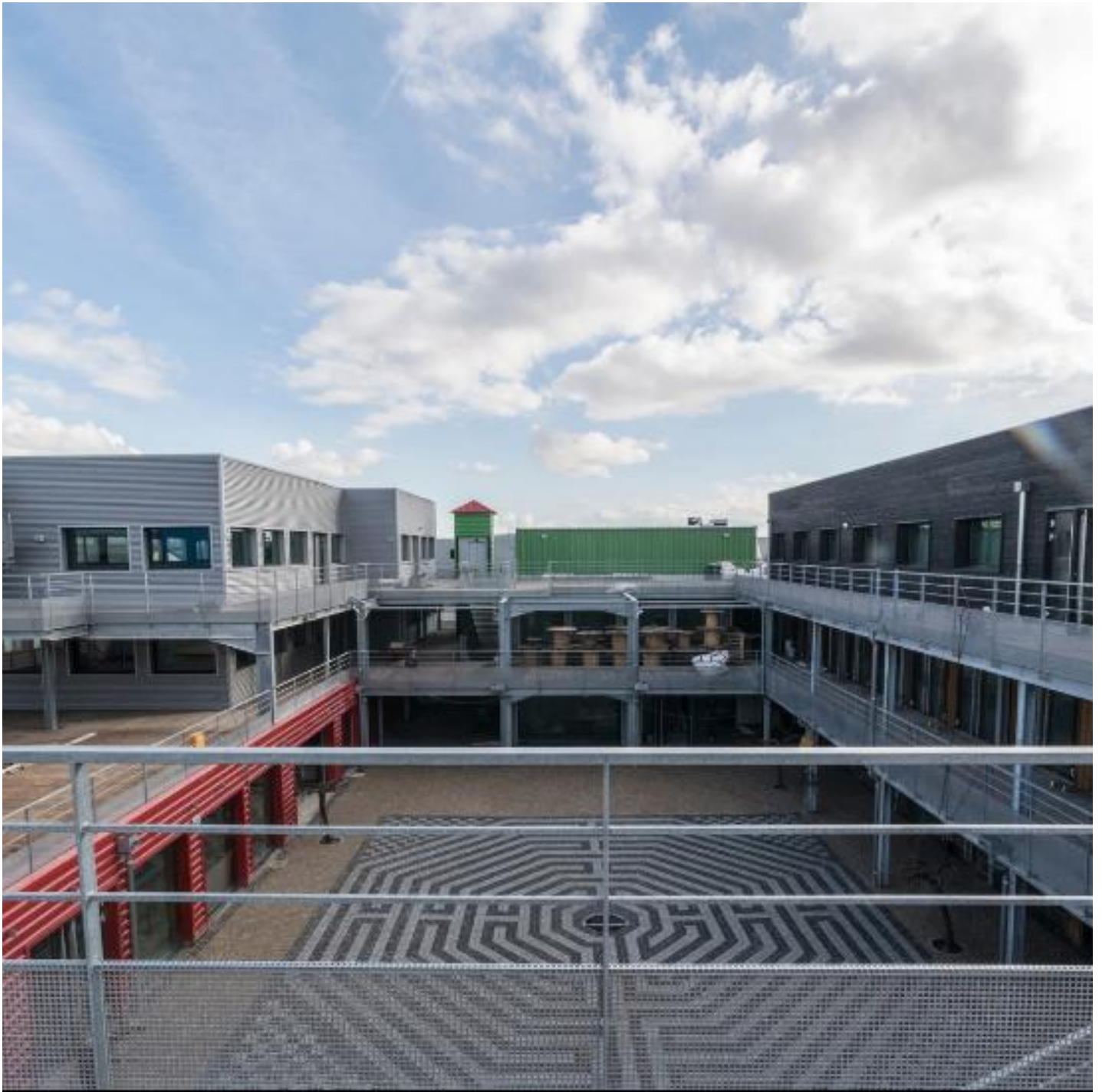
ZOOM SUR LA CONSTRUCTION DU "VILLAGE DES TALENTS CRÉATIFS", UN LIEU COMMERCIAL ET CULTUREL ÉCO-RESPONSABLE